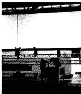
Tre fasi dei preparativi per l'assemblea Ubi: decine di addetti sono al lavoro in fiera

E «Insieme per Ubi» conferma l'appoggio a Moltrasio